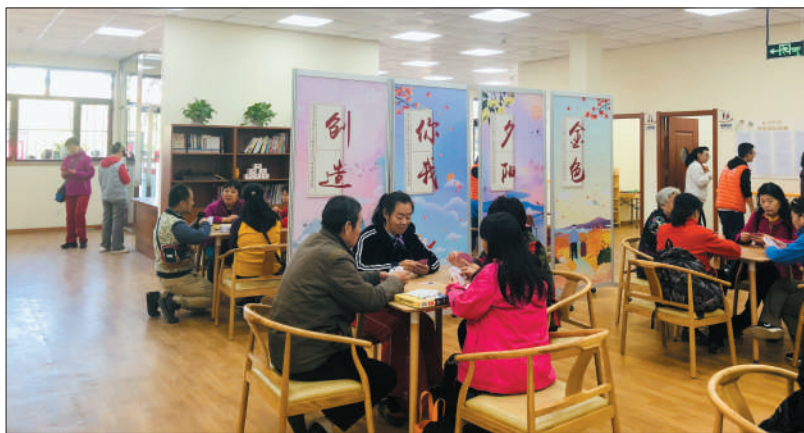
桃园养老驿站中,大家正在进行各种益智、娱乐活动。

“我85岁的老妈这回午饭算是有着落了,只要一个电话就能让老太太吃上放心的饭。”在桃园养老驿站里,居民